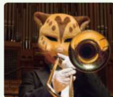
アムールヒョウ / トロンボーン