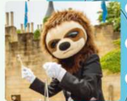
ナマケモノ / バーカッション