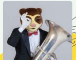
メガネグマ / チューバ