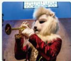
ホワイトライオン / トランペット