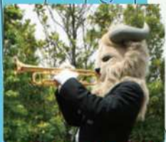
ゴールデンターキン / トランペット