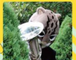
オセロット / ユーフォニアム