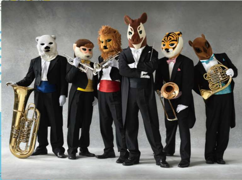
オカピ / 指揮者