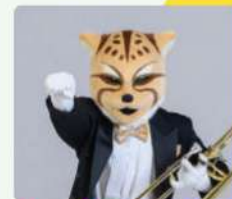
チーター / ユーフォニアム&トロンボーン