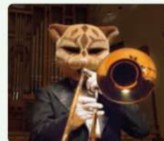
雲豹 うんびょう / バストロンボーン