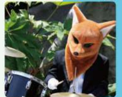
ドール / バーカッション