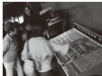
音響室から音を出してみます