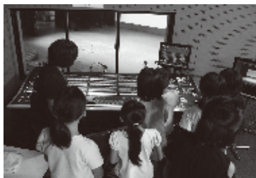
調光室で照明の色を変えてみます