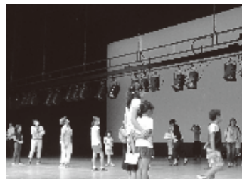
ライトがたくさん吊ってあります