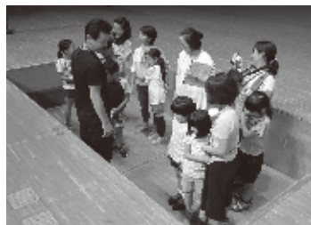
「せり」で降りています