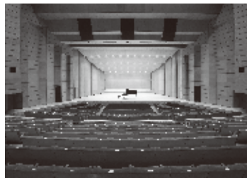
大ホールの客席からの眺め