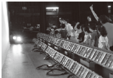
ステージにあがってみます