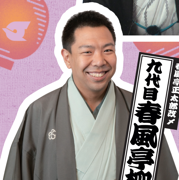
春風亭正太郎改メ 九代目春風亭柳枝