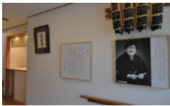
総武線「平井駅」南口より徒歩10分程度

江戸川区平井にある「ひらい圓藏亭」では、フレッシュな二ツ目落語家の会、社会人落語家による圓藏亭落語会、江戸御府内八十八カ所(東京版お遍路コース)を描いた水彩画展など、様々なイベントを開催中! 落語文化の発信地・ひらい圓藏亭にぜひお出かけください。