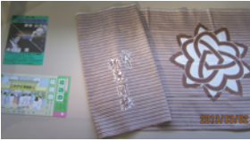
▲橋家圓藏の手ぬぐいなど