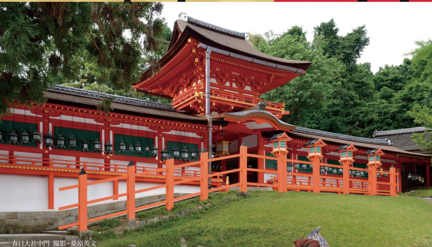
春日大社中門