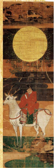
けんぼんちやくしよくかしまだちんえいず 絹本着色鹿島立神影図 〔有形文化財(絵画)〕 南北朝時代(永徳3年/1383)