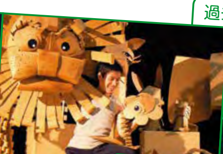
お花のハナツクの物語