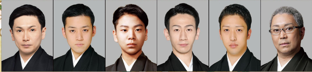
ばんどうかめぞう 坂東亀蔵